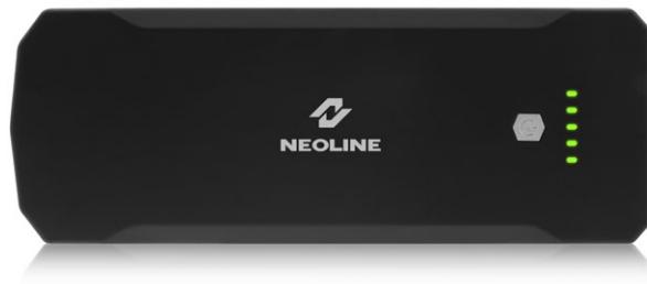
NEOLINE Jump Starter 850A